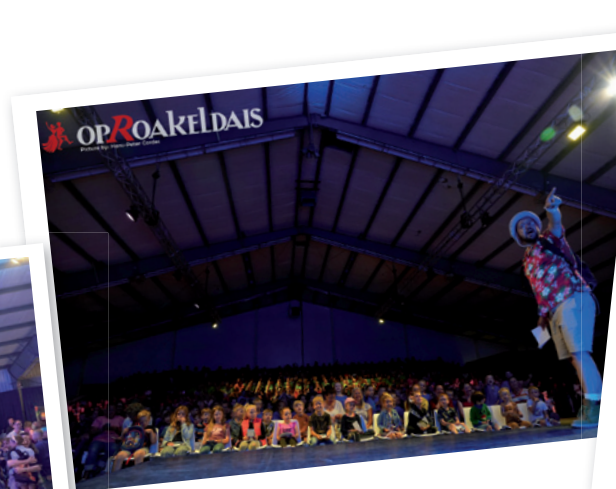
Scholendag: ademloos genieten