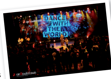
Dance Together met Oezbekistan

Vanaf dat moment zijn er diverse projecten ontstaan. De directeur van de groep en de artistiek directeur konden nu wederom samen op het podium staan en uitleg geven over dit humanitaire project en kregen een staande ovatie. Dit laat zien dat de kracht en impact van Festival Op Roakeldais groter is dan alleen dans, muziek en cultuur. Onder andere op deze manier probeert het festival het verhaal achter de deelnemende groep aan het publiek te tonen.