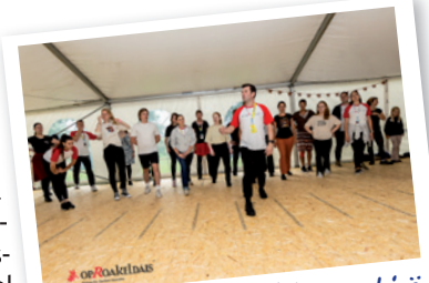
Workshop Kroatië op de CIOFF-camping