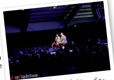
In gesprek met een danser uit de USA tijdens Youth Day

In het voortraject is het festival een nieuwe samenwerking met de Kunstkerk Hogeland aangegaan. Beide partijen zijn in gesprek gegaan met diverse Middelbare scholen om input te halen voor de invulling van het programma en afstemming te zoeken om een aanbod te creëren waarmee de jonge doelgroep op creatieve wijze kennis kan maken met kunst - en