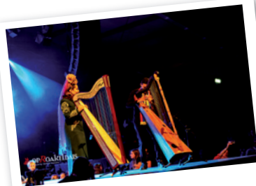
Harpen in de schijnwerpers