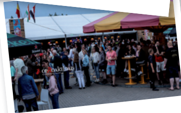
Op Roakeldais Plein