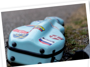
Muzikanten in de spotlights