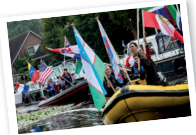
Welkom in Warffum