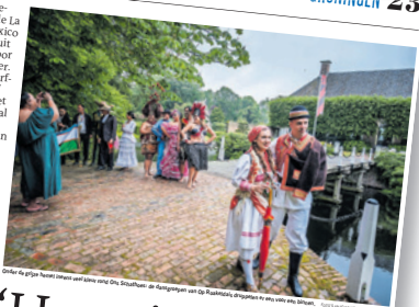
Deelnemers aan de eerste kennismaking op borg Verhulder, in 'Nederland is mijn tweede thuis'.

Een Nieuw-Zeelands Haka, de La Bamba uit Mexico en cadeaus uit Oezbekistan voor de burgemeester. Warffum staat vanaf donderdag in het teken van Festival Op Roakeldais. Een reportage van de eerste kennismaking op borg Verhulder, in 'Nederland is mijn tweede thuis'.