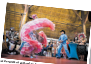
Deelnemers aan de eerste kennismaking op borg Verhulder, in 'Nederland is mijn tweede thuis'.